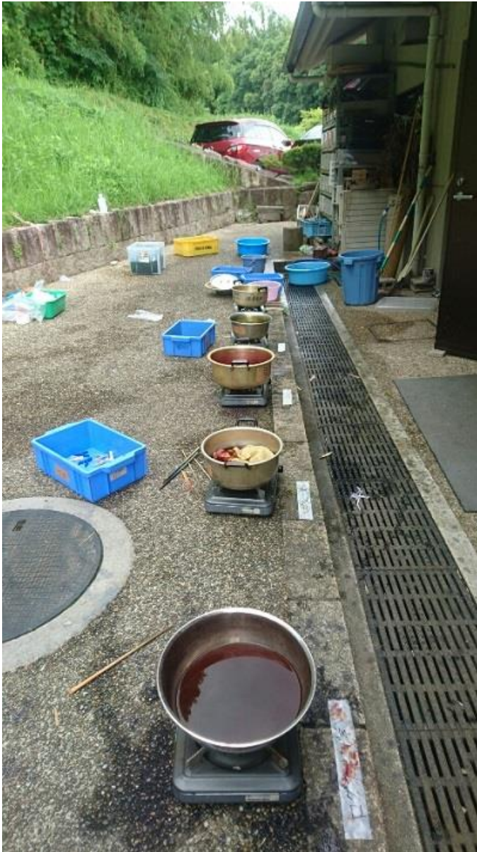
沢山の鍋が並びました。クラフトサークル員の Y さんが色々染料や媒染の薬等持ってきてくださり指導してくださいました。